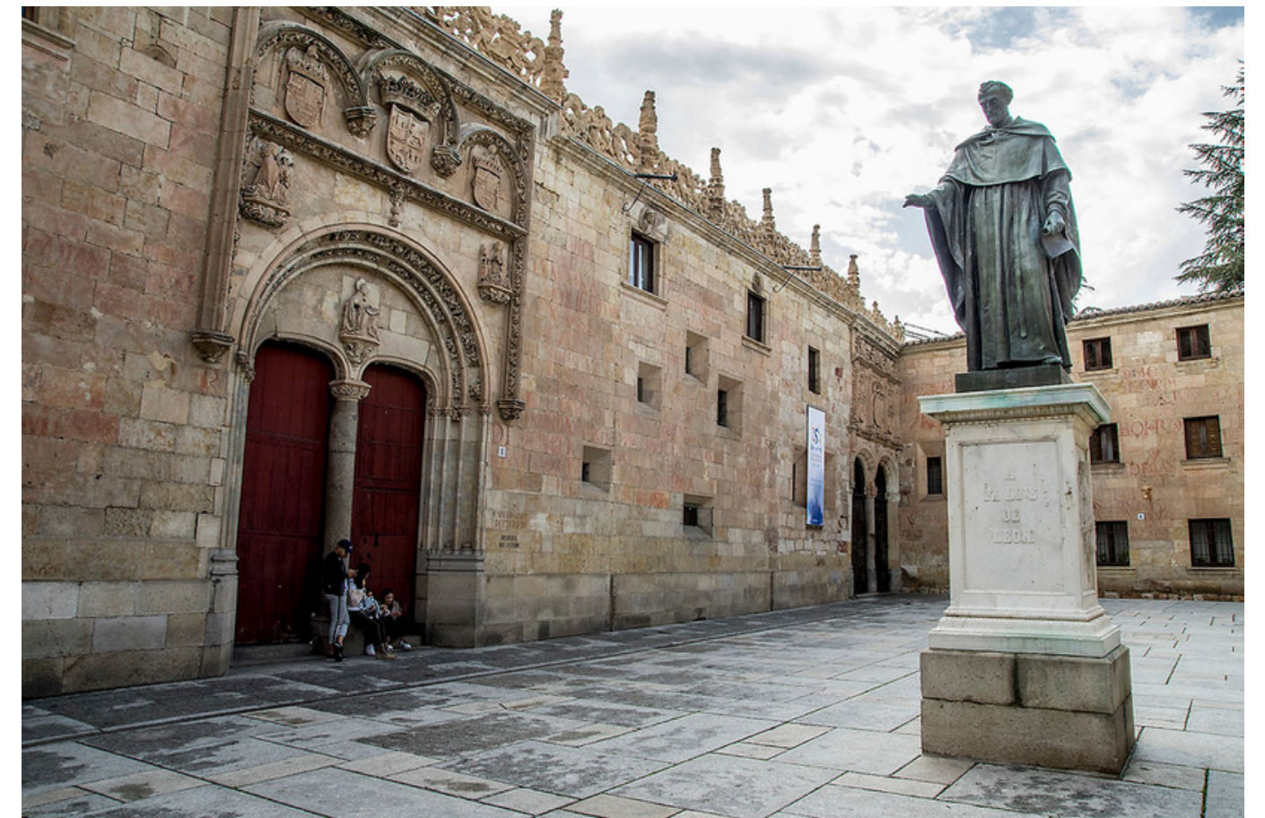
Universidad de Salamanca. Fray Luis de León.