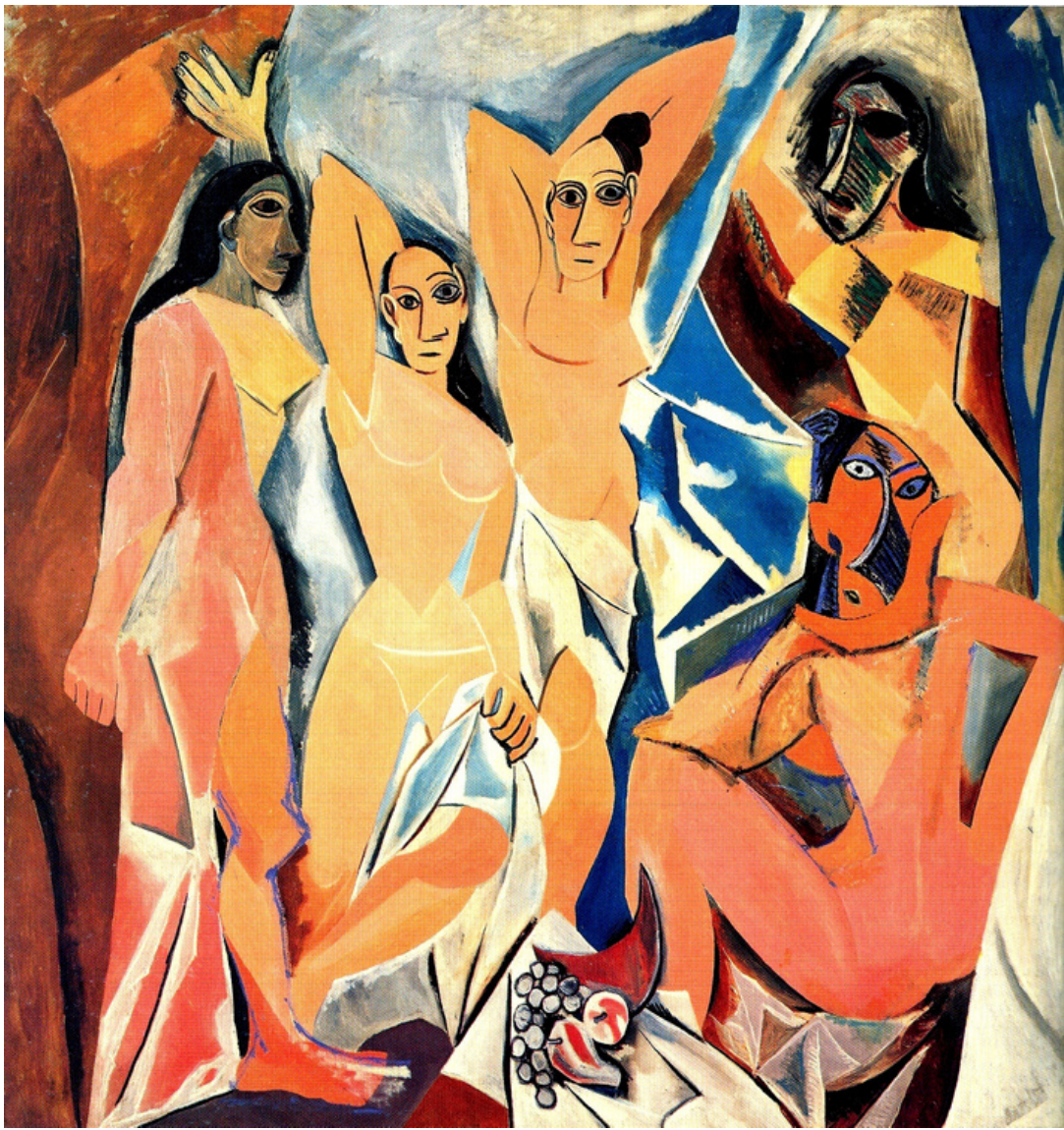
Las señoritas de Avignon, Picasso (Cubismo)