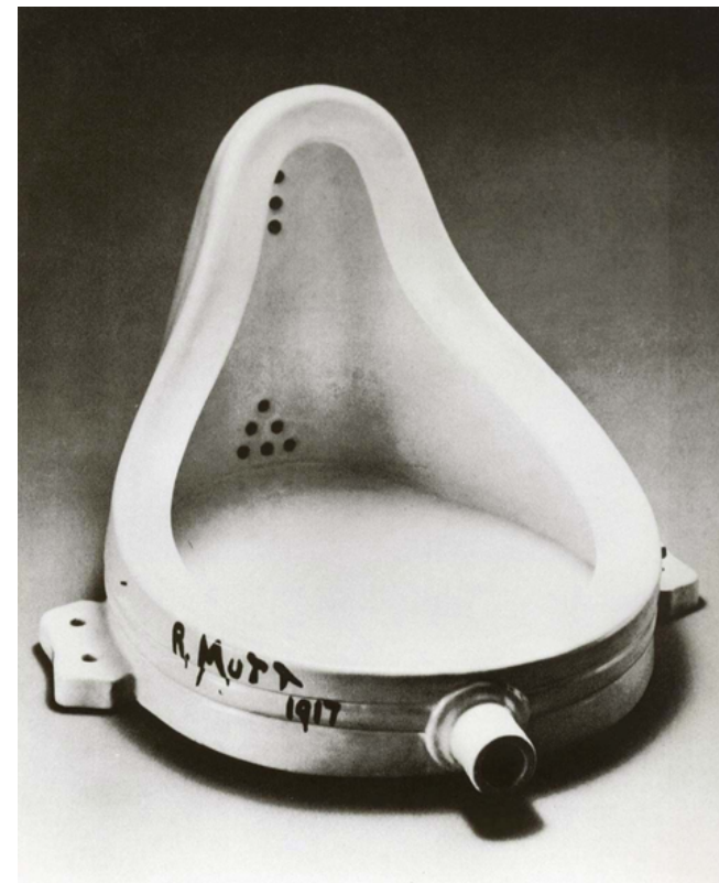
La fuente, Marcel Duchamp (Dadaísmo)