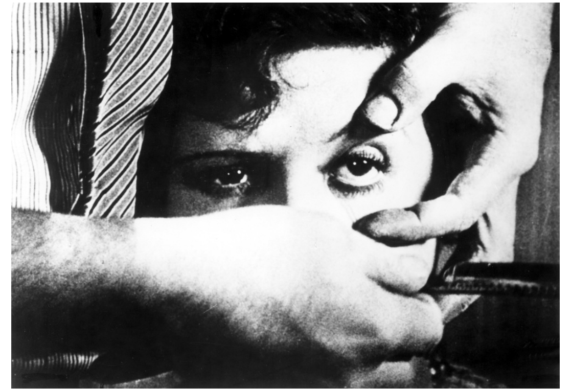
Un perro andaluz, Luis Buñuel (Surrealismo)