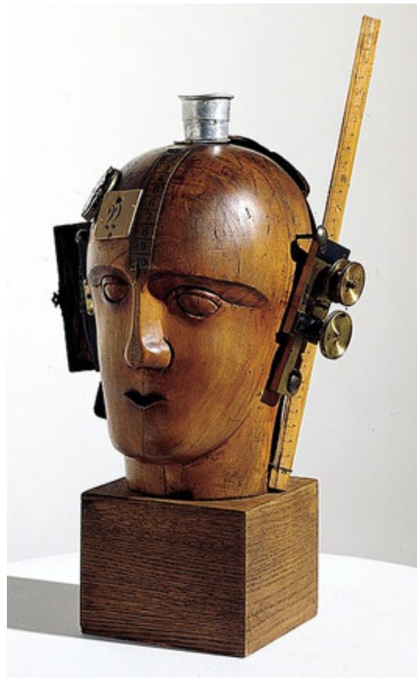
Cabeza mecánica, Hausmann (Dadaísmo)